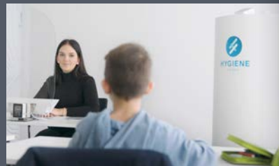
Ein Schritt in Richtung Normalität