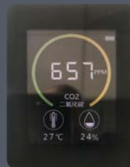
Luftqualitäts-Anzeige mit CO 2 Ampel

Deutschlands erste geprüfte und zugelassene Luftreiniger für Corona BioStoffV Risikogruppe 3 Covid 19